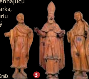
Barokové drevené plastiky vystavené v Múzeu Janka Kráľa.

9 Slnečné hodiny na južnej strane kostola zdobí keramický reliéf zachytávajúci boj sv. Juraja s drakom.