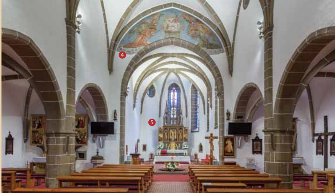
Pohľad do hlavnej lode s triumfálnym oblúkom (4) v osi kostola a Oltárom sv. Mikuláša (5) v pozadí. V bočných lodiach za mohutnými stĺpmi sa rysujú oltáre č. 2 a 6.

Prezrite si skvosty najstaršej stavebnej pamiatky mesta – najväčšej ranogotickej stavby Liptova! Postavený bol ako farský kostol pre 5 neďalekých osád. Spočiatku stál osamotený uprostred krajiny, postupne sa okolo neho rozrastalo mestečko Svätý Mikuláš. Táto impozantná sakrálna stavba stojí na mieste staršieho románskeho kostolíka z 11. – 12. storočia, ktorý pri výstavbe jednoloďového kostola v rokoch 1280 – 1300 prevzal úlohu sakristie a je najstaršou časťou súčasného chrámu. V polovici 15. storočia bol kostol rozšírený a zaklenutý, veža bola nadstavaná a upravená v neskorogotickom slohu. V tom období kostol spolu s neďalekou Pongráčovskou kúriou opevnili a obohnali vodnou priekopou; neskôr prešiel barokovou prestavbou. Vo svojej ranogotickej podobe sa chrám opäť zaskvel po rozsiahlej rekonštrukcii v rokoch 1941 – 43, kedy odstránili opevňovací múr a pristavali bočné kaplnky. Následne v celom kostole osadili nádherné vitrážové okná.